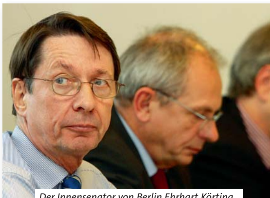
Der Innensenator von Berlin Ehrhart Körting.

Die Erörterungen zu den vom dbb berlin vorgeschlagenen weiteren Themen: Personalbedarfskonzept 2013, Bearbeitung der Anträge auf Gewährung von Beihilfen, Verhältnis von § 76 Absatz 3 Satz 3 2. Halbsatz LBG zur § 46 Absatz 2 LBhVO, Dienstrechtsreform in den Modulen Besoldung und Versorgung, Gewährung von Mehrarbeitsvergütung und Erschwerniszulagen, Versorgungsauskünfte, Anpassungsfaktoren nach § 69 e BeamtVG, Informationen zur „Versorgungslücke nach § 14 a BeamtVG im Bereich der Bildungsverwaltung, Versorgungsabschlag für teilzeitbeschäftigte Beamtinnen, Bekleidungsordnung für die Berliner Justizverwaltung, Einführung der integrierten Sekundarschule/dienstrechtliche Begleitvorschriften, Ausführungsvorschriften über die Verpflichtung zum Tragen von Dienstkleidung, Anforderungen von Personalakten durch die Strafverfolgungsbehörden, Ände-