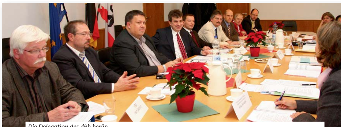
Die Delegation des dbb berlin

Den vom dbb berlin auch aus Gerechtigkeitsgründen eingeforderten finanziellen Ausgleich der Gehaltskürzungen seit 2003 zum 1. Januar 2010 will der Senat mit Hinweis die finanzielle Lage des Landes Berlin und